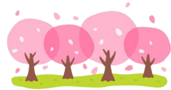
【1学期の補聴器相談日】